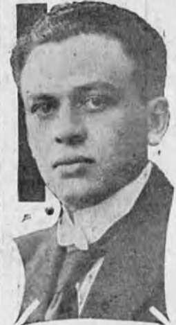
Dr. don Ricardo Moreno Cañas